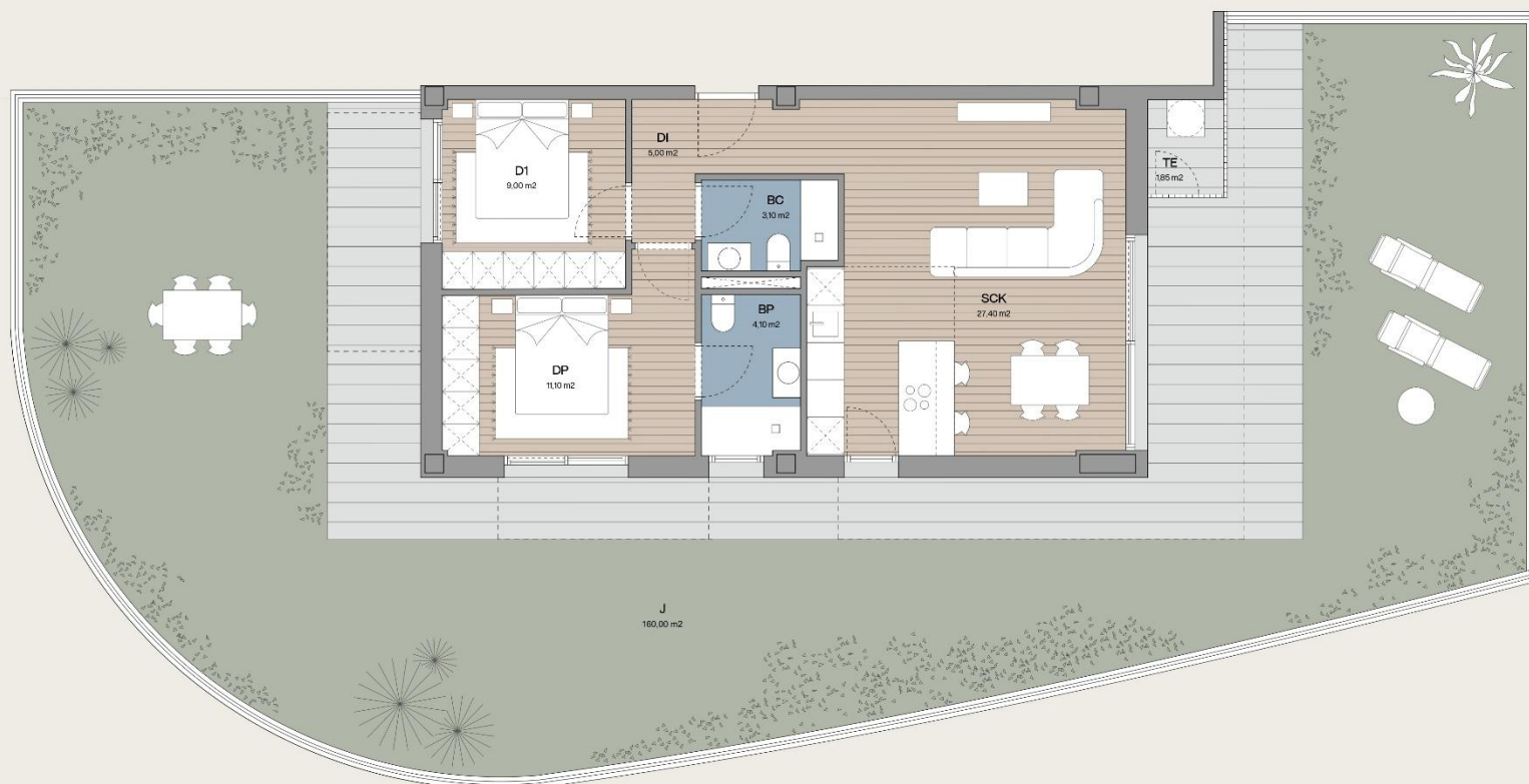
PORTAL A BAJO DERECHA