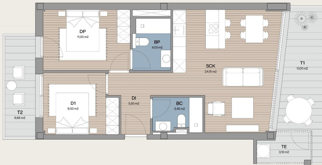
PORTAL C 2º IZQUIERDA